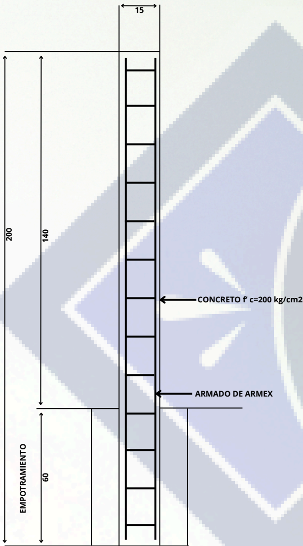
DETALLE POSTE DE CONCRETO